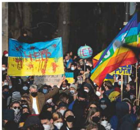
Demonstranten in Berlin am 27. Februar

Aber ist Butscha nicht wie ein zweites Srebrenica? Ein Wendepunkt, der alles ande-